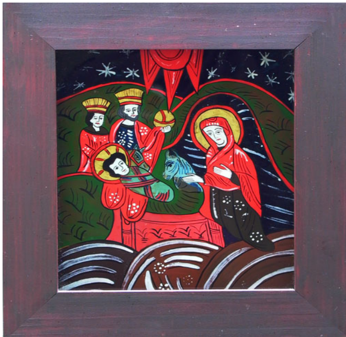
Nașterea Domnului – icoană pe sticlă de Carmen Indergand-Bira